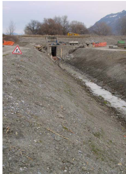
Cantiere sul canale Sion-Riddes