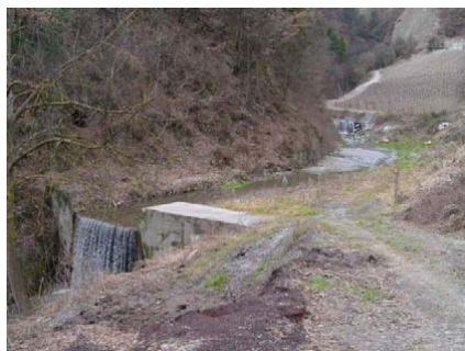
Deposito sulla Salentse