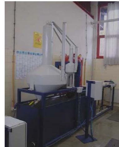
Atelier de réparation des compteurs