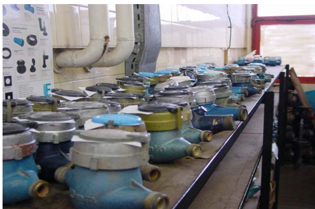
La création d'un atelier d'étalonnage des compteurs a permis de restaurer la confiance et d'assurer la facturation du service