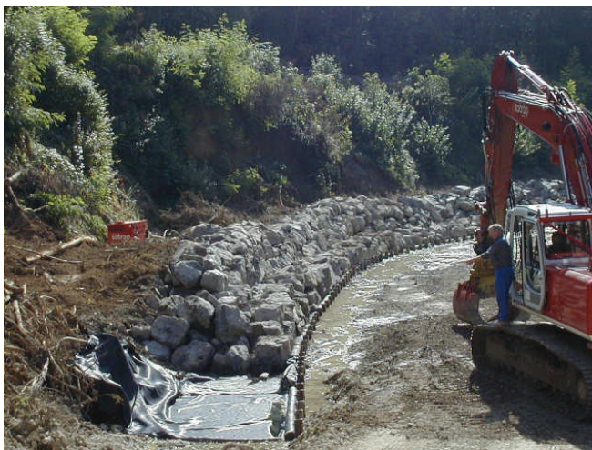
Exécution de l'empierrement