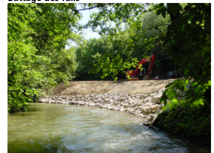
Situation après travaux du site de Reverule