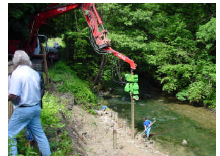
Battage des rails