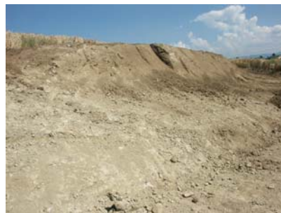
Corps de la butte