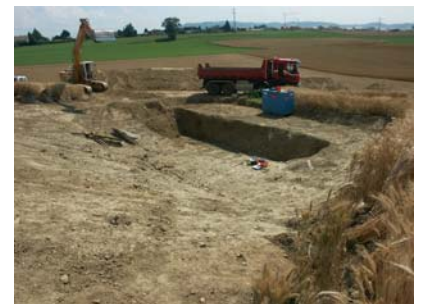
Fond de fouille