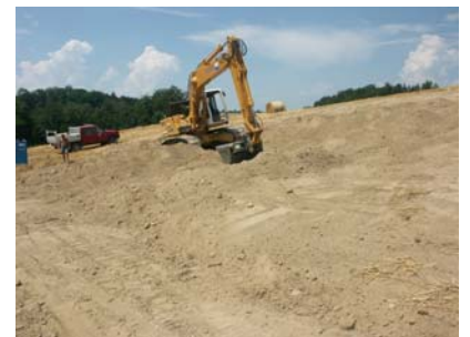
Remblayage du site