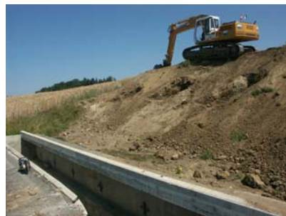
Terrassement par couches