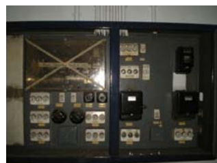
Quelques éléments contenant de l'amiante