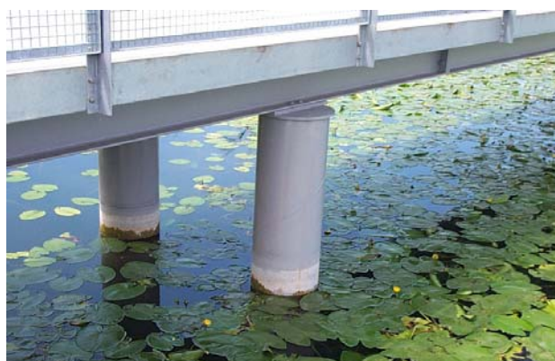
Détail des têtes de pieux