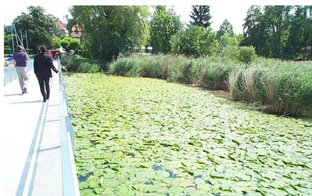
Nupharaie et roselière