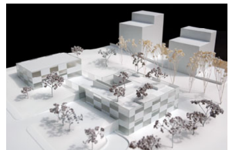
Maquette du projet de nouvelle crèche

Dans des projets immobiliers exigeants, CSD appuie le propriétaire pour le suivi des entreprises et des mandants et le contrôle des budgets, de la qualité et des délais.