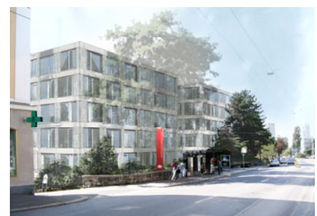
Photomontage du bâtiment Cour 107