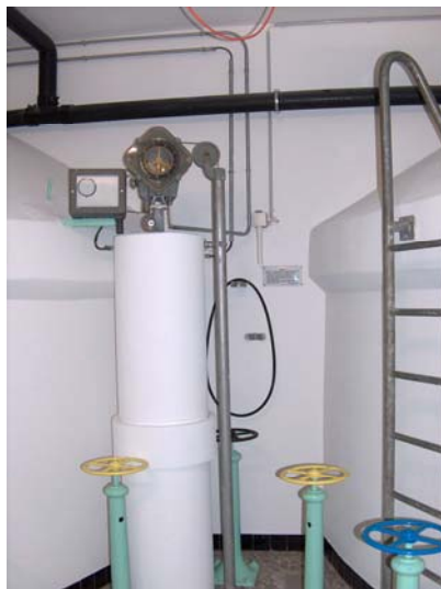
Réservoir n° 2