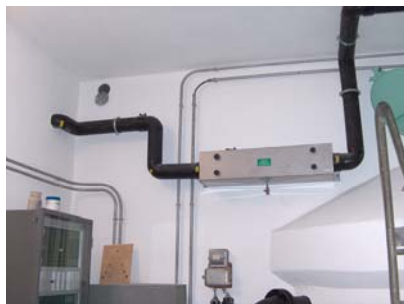
Réservoir n° 2 Filtration d'air