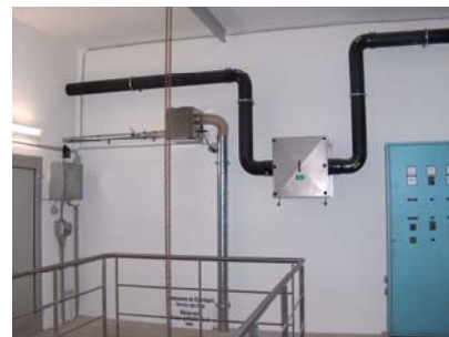
Réservoir n° 3 Filtre à air pour réservoir et déshumidificateur