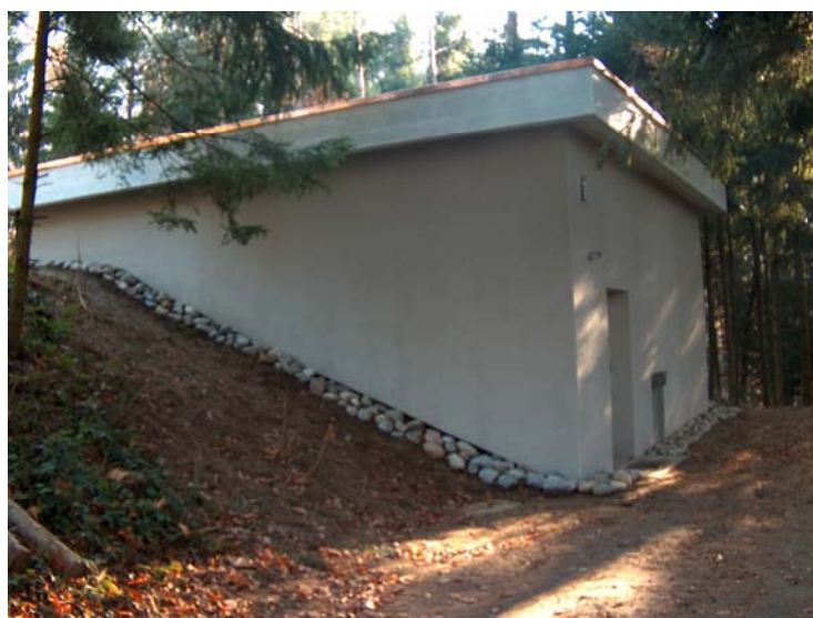
Extérieurs du réservoir n° 3