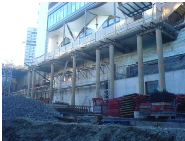
Reprise en sous-œuvre