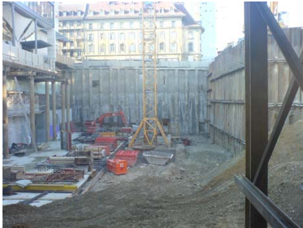
Vue d'ensemble de la fouille de l'étape 1