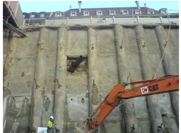
Paroi berlinoise à l'Avenue de la Gare