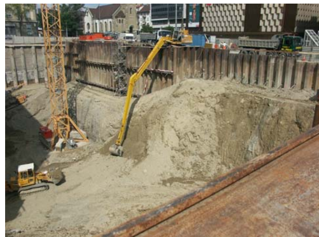
Engin adapté aux conditions d'exécution