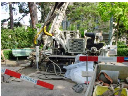
Les carottes extraites par forage renseignent sur la nature du sous-sol et permettent d'évaluer les risques hydrogéologiques et géotechniques