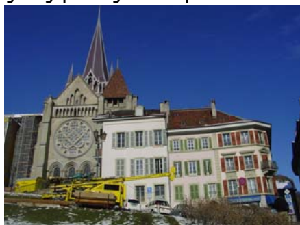
Les atteintes aux monuments historiques classés, comme la Cathédrale de Lausanne, doivent à tout prix être évalués et limités lors des travaux de percement