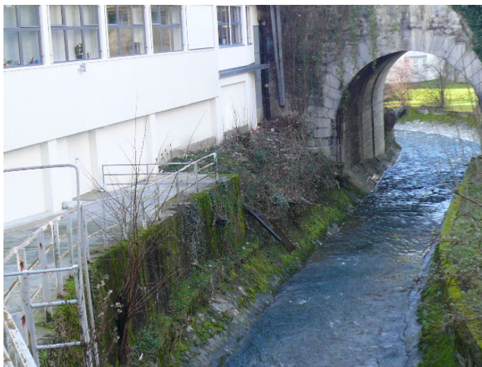
L'analyse professionnelle des points de déversement des eaux fait partie du contenu des visites du site

Ces « Due Diligence » sont souvent réalisés en anglais et dans des délais très courts .