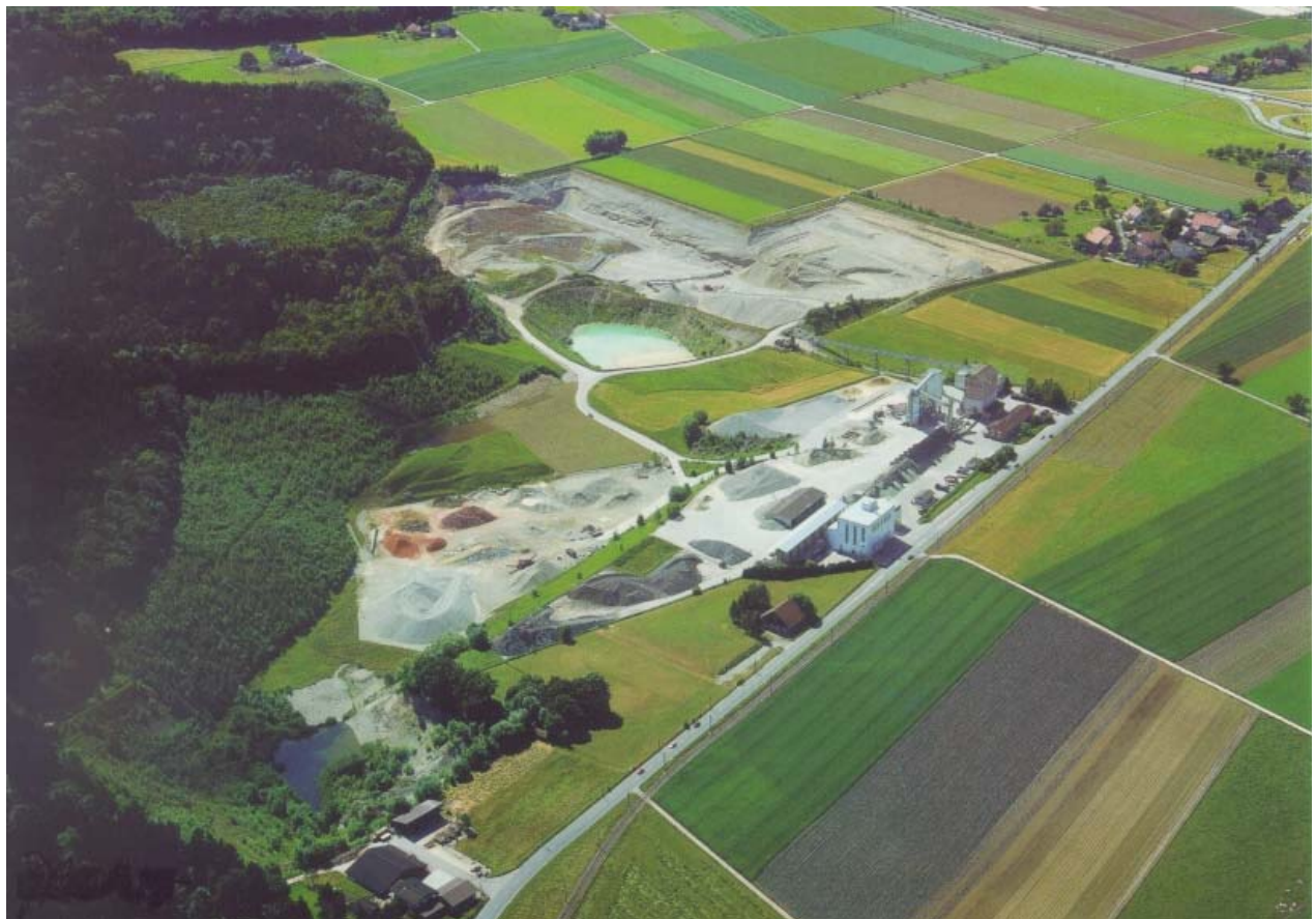
Luftaufnahme der Kiesgrube IFF mit Kies- und Betonwerk