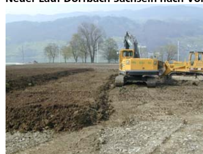
Rekultivierung von Kulturland