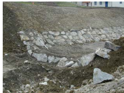
Bau des Raubbettgerinnes