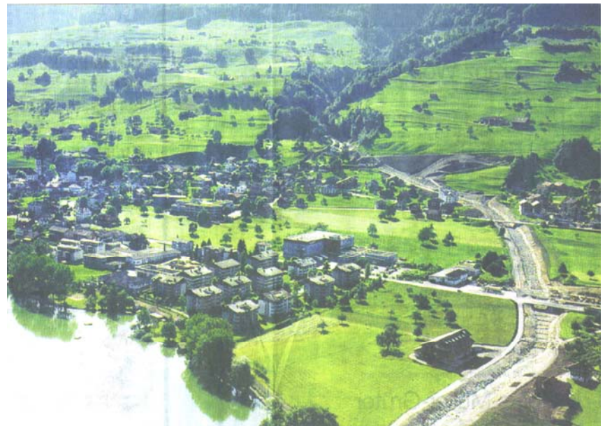
Neuer Lauf Dorfbach Sachseln nach Vollendung