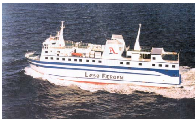
Traghetto scandinavo, un tipo di traghetto preso in considerazione per il lago Lemano