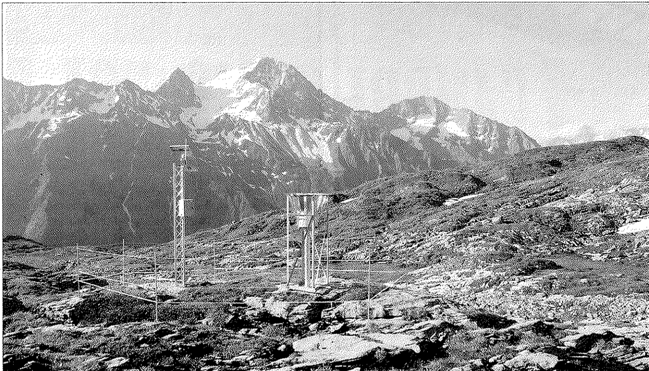
Die Online-Regenmessstation auf dem Ortliboden im Maderanertal.