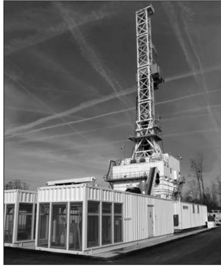
Le fait de disposer d'une alimentation électrique externe ou de générateurs sur place est évidemment significatif aussi en termes d'émissions de bruit ou de polluants atmosphériques.

Les tours de forage utilisent l'énergie électrique et les puissances nécessaires sont considérables. En général, les compagnies ont l'habitude de fournir l'électricité dont elles ont besoin par des générateurs au diesel installés sur place. Ceux-ci respectent les normes européennes mais pas les exigences suisses en matière d'émissions de