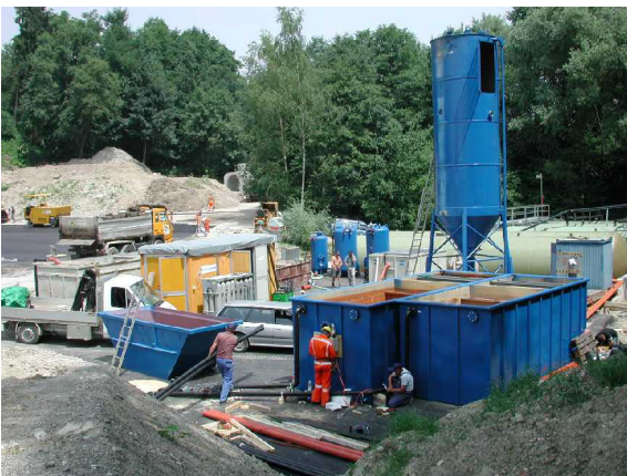
Abb.2: Abwasserbehandlungsanlage der Baustelle "Drainage Süd" bei der Sondermülldeponie Kölliken (AG)

Die zweite Linie wurde zum Behandeln von Abwasser der Betonanlage, der Triagehalle, der Bohrarbeiten und des mit Deponiesickerwasser verschmutzten Baustellenabwassers entworfen. Da es sich bei diesem Abwasser um ein Vielstoffgemisch handelt, musste eine verfahrenstechnisch aufwendigere Behandlungsanlage konzipiert werden, bestehend aus einer Grobstoffseparation, Neutralisation, Flockung und Sedimentation, Sandfiltration und einer abschliessenden Aktivkohleabsorption.