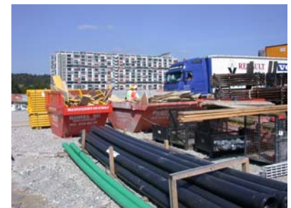
Installationsplatz, Umgang mit Baustellenabfall