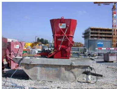
Waschplatz für Betonkübel