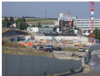
Übersicht Baustelle Süd