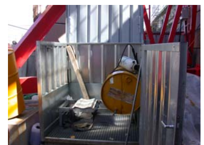
Lagerung wassergefährdende Flüssigkeiten in Containern