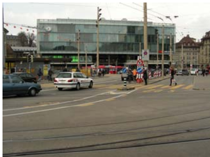
Der alte Bahnhofplatz