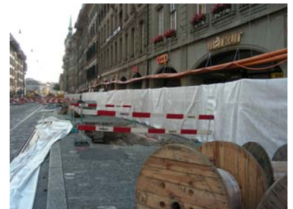
Staubschutzmassnahmen gegen die Lauben